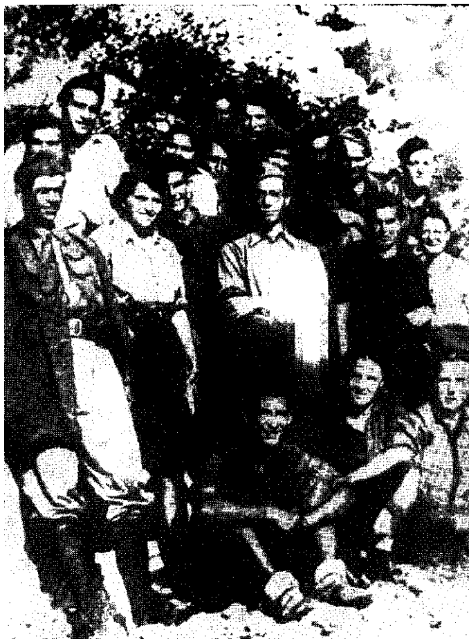
U Biokovu je za vrijeme Narodno oslobodilačke borbe izlazilo glasilo NOP-a »Naše vijesti«, koje su obavještavale borce i narod o najnovijim vojno-političkim zbivanjima. Na slici: grupa teren:ko-političkih radnika sa članovima blokovske »tehnike« koja jz uređivala i stampila »Naše vijesti«