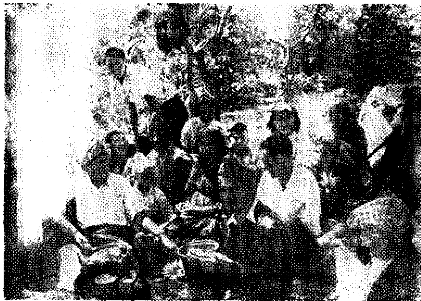
Borci na položaju jedu hranu, koju su im donijele žene blokovskih sela