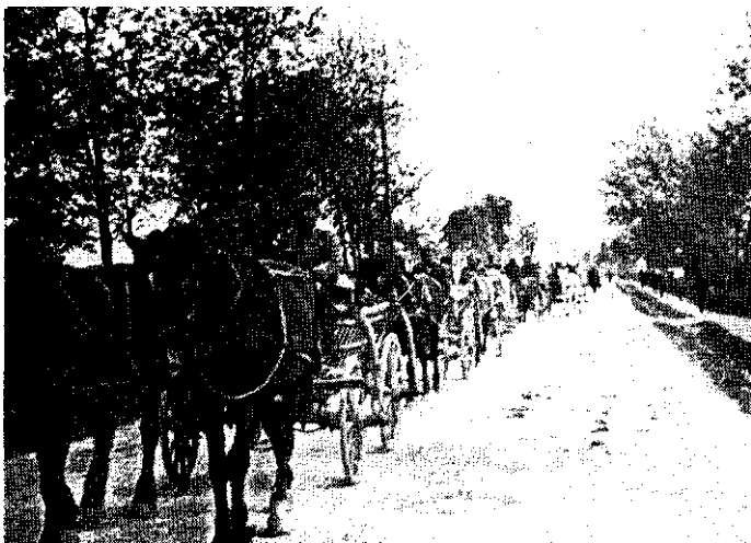
Комора једне јединице 25. НОУ дивизије.

сници били махом десетари и водници. Петнаестог децембра почео је при штабу дивизије и војни курс, углавном за десетаре и воднике и понеког члана команде чете. Завршен је и санитарски курс дивизије, на коме је учествовало 60 другарица.