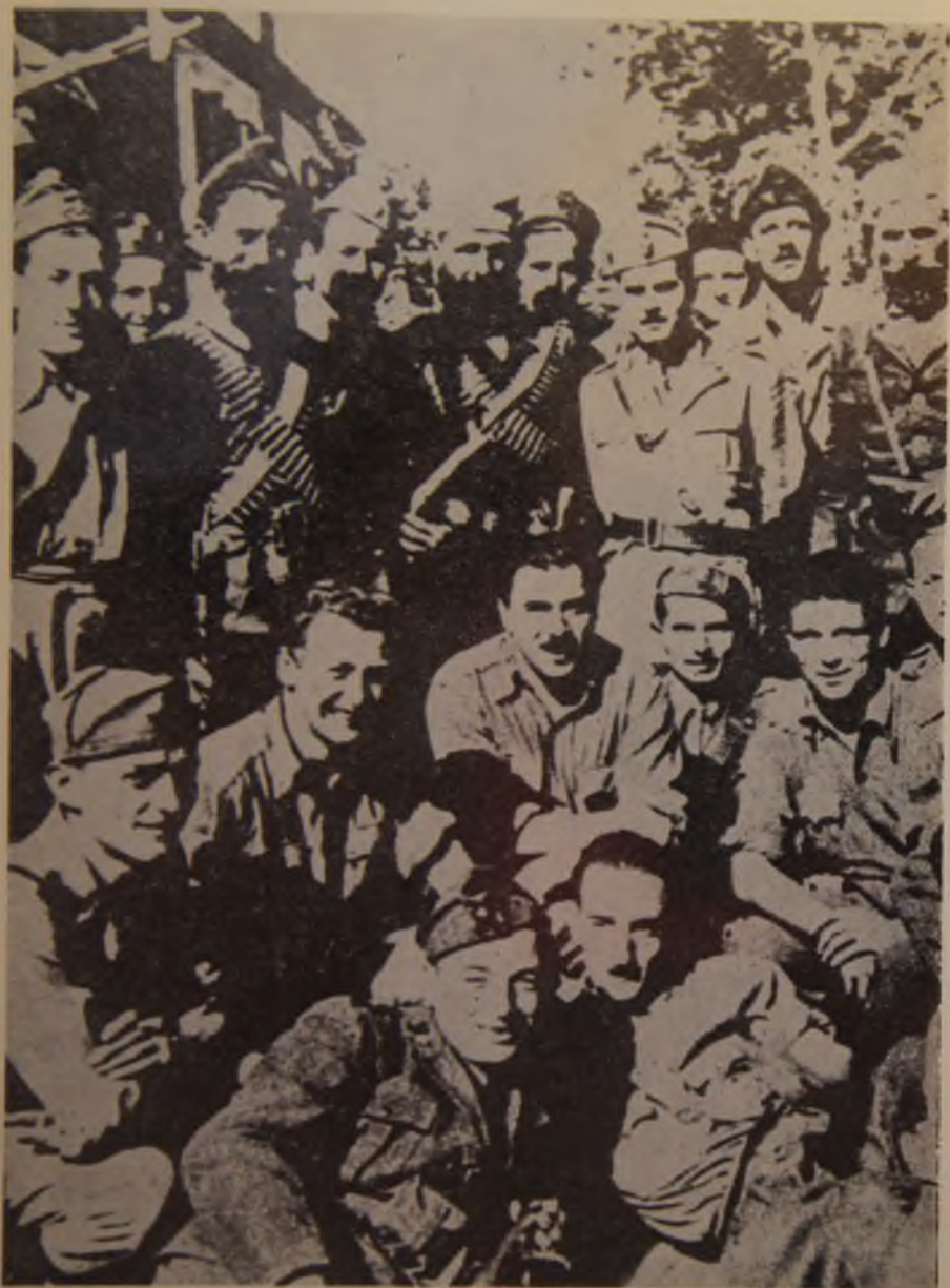
34. Hercegovački četnici i italijanski okupatori, nerazdvojni saveznici u borbi protiv NOP