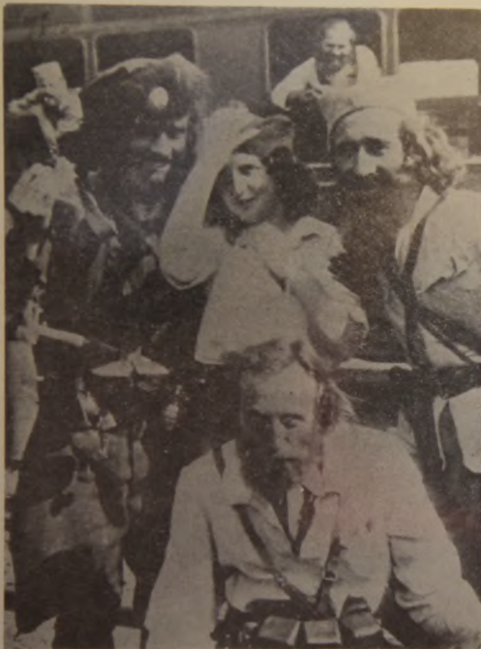
32. Crnogorski četnici na železničkoj stanici u Nikšiću pred polazak prema Neretvi februara 1943. godine