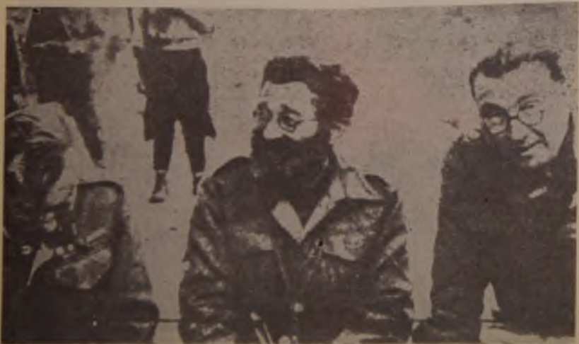
44. Draža Mihailović (u sredini) sa britanskim pukovnikom Bejljem (prvi zdesna) po dolasku u Srbiju, juna 1943. god.