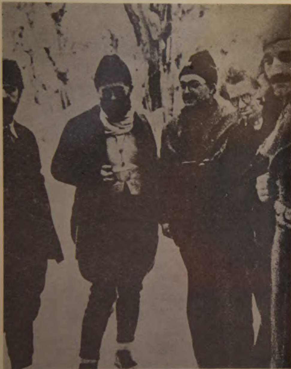
28. Draža Mihailović (drugi sleva) sa britanskim pukovnikom Bejljem (treći sleva) u Lipovu kraj Kolašina u zimu početkom 1943. godine