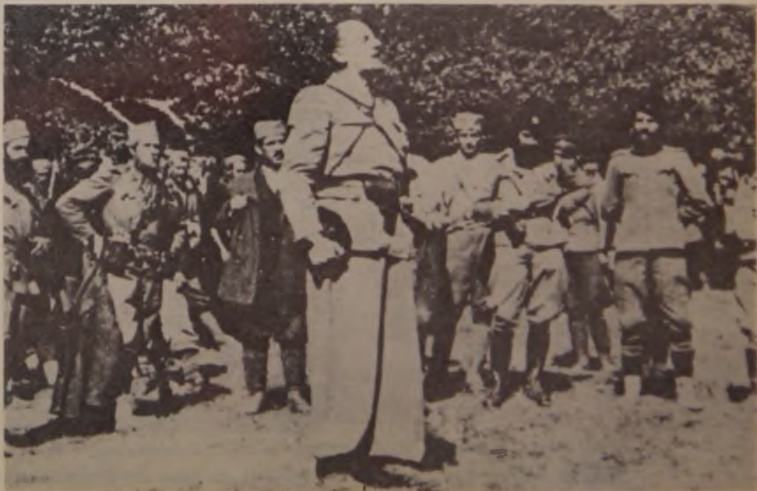
8. Četnički vojvoda Dobroslav Jevđević poziva hercegovačke četnike u borbu protiv NOP