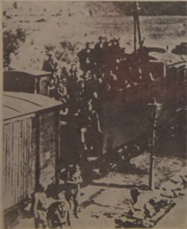
14. Okupatori transportuju četnike Momčila Đujića u borbu protiv NOP