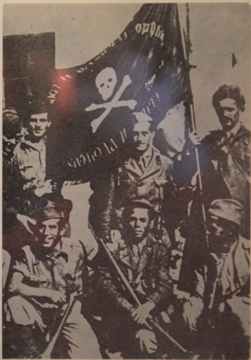
18. Pod četničkom zastavom našli su se i italijanski okupatorski vojnici