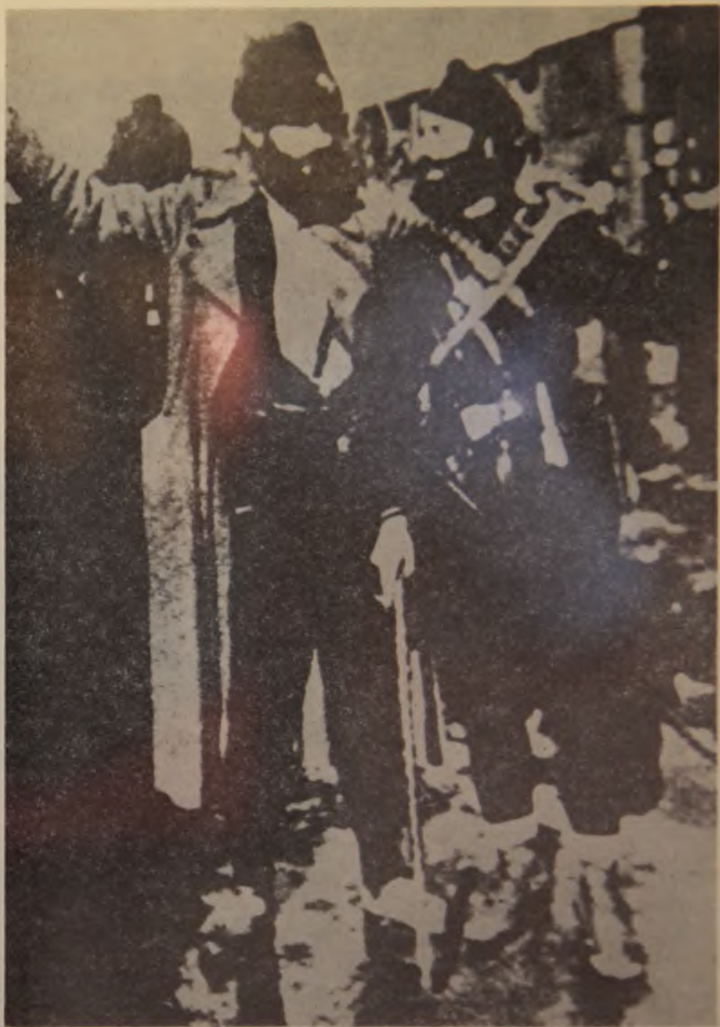
33. Crnogorski četnici na železničkoj stanici pred polazak prema Neretvi februara 1943. godine