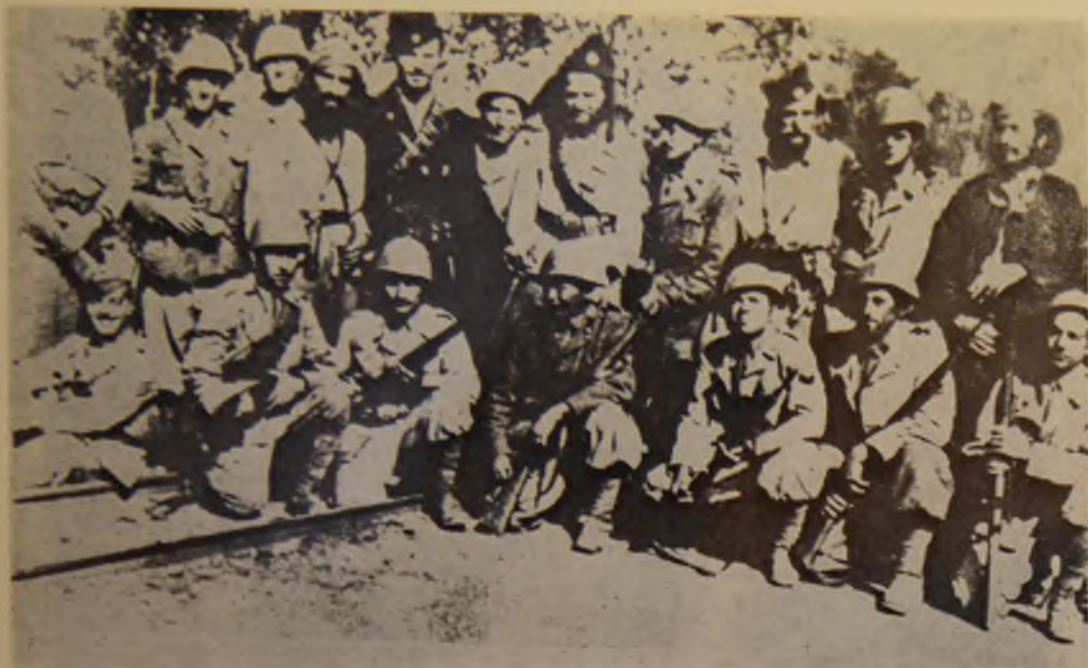
9. Grupa hercegovačkih četnika i Italijanskih vojnika u Jablanici u leto 1942. godine