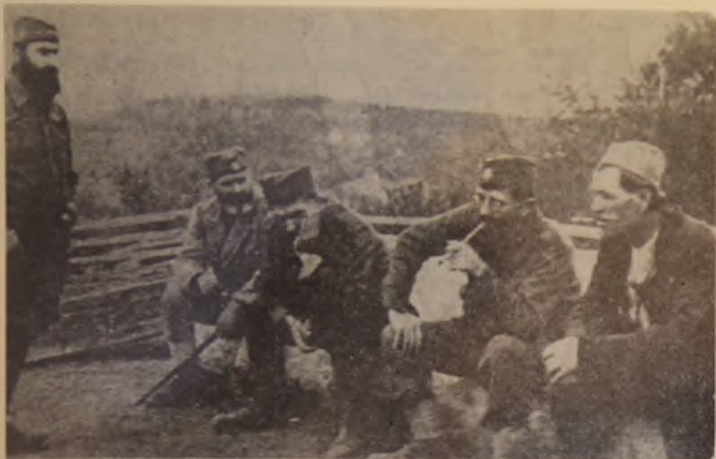
40. Draža Mihailović (drugi zdesna) sa svojim saradnicima prilikom bekstva iz Crne Gore maja 1943. godine