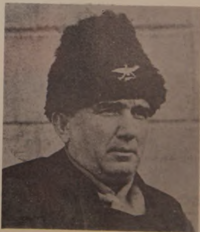
22. Četnički komandant Srbije, od jeseni 1942. godine, general Miroslav Trifunović — Dronja