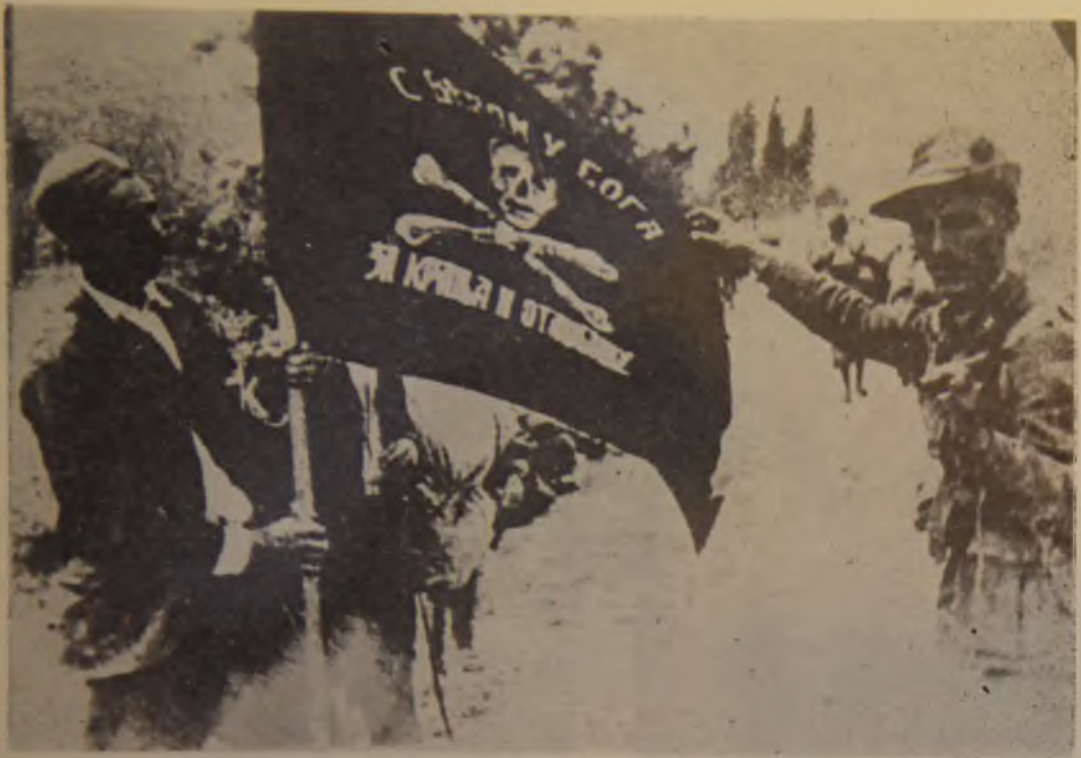
13. Zastava izdaje u rukama četnika i italijanskog okupatorskog vojnika