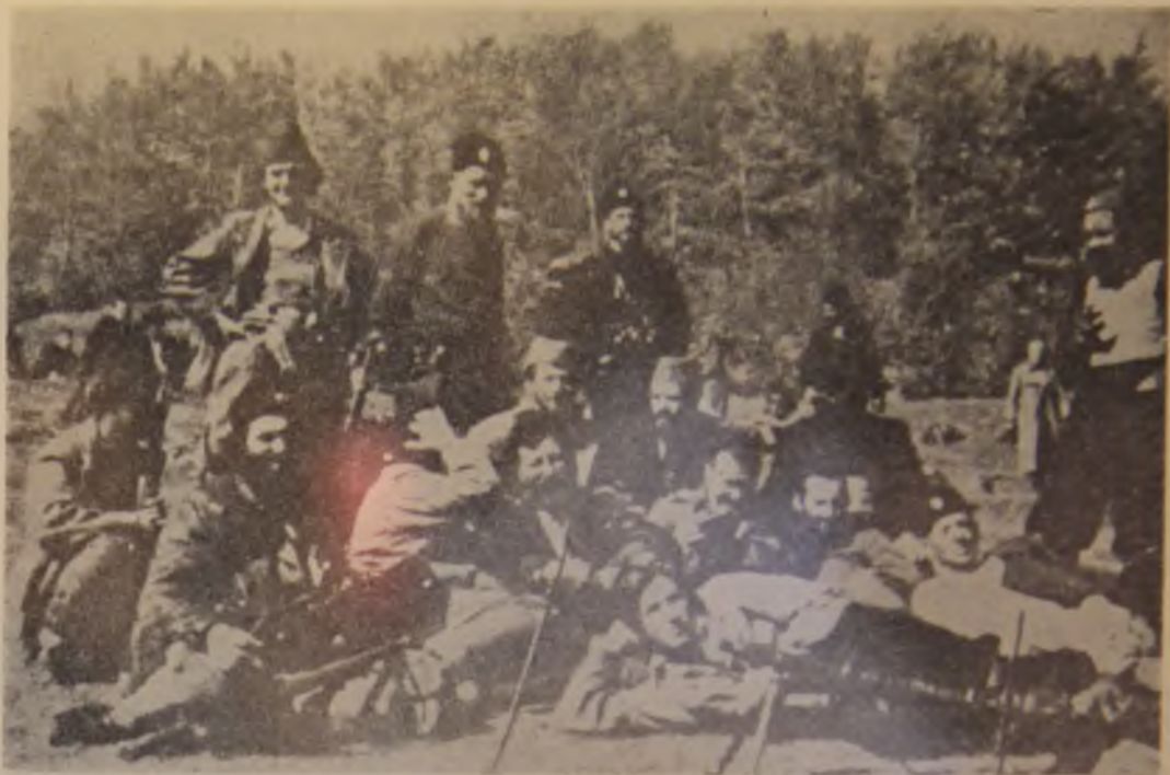
26. Četnički vođa Draža Mihailović (sedi u sredini) sa grupom četnika Bože Javorca u jesen 1942. godine