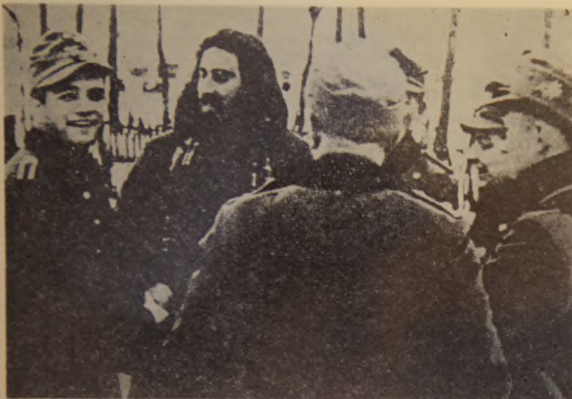
5. Nemački okupatori očigledno zadovoljni četničkom saradnjom u borbi protiv NOP