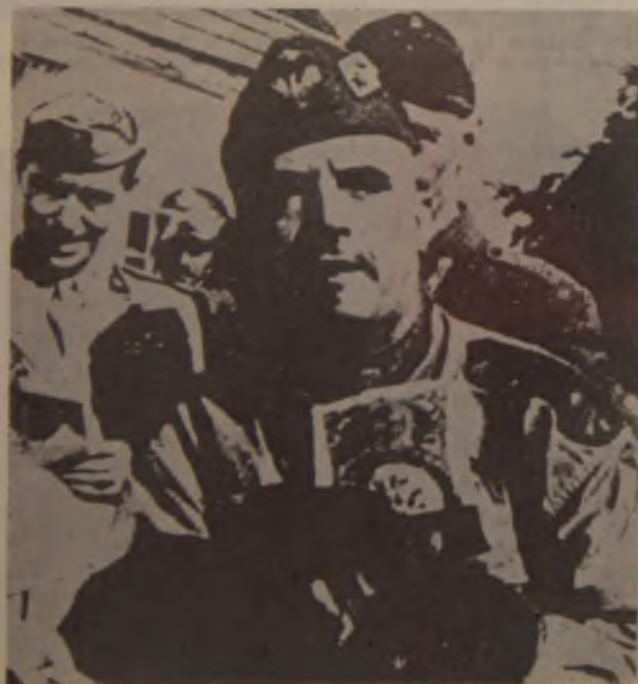
10. Italijanski general Mario Robotti