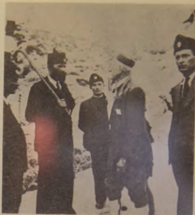
21. Četnički komandant pukovnik Bajo Stanišić (drugi sleva) u razgovoru sa svojim potčinjenim komandantima