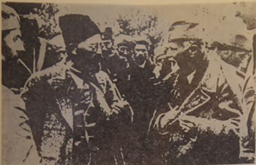
43. Draža Mihailović (u sredini) sa Dragišom Vasićem (prvi zdesna) i kapetanom Predragom Rakovićem (prvi sleva) u Sandžaku maja 1943. godine