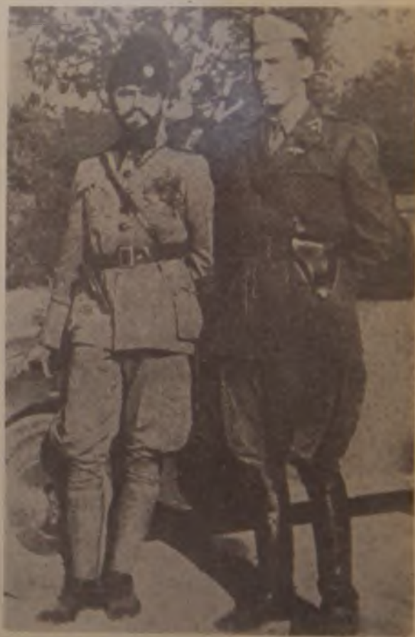
12. Iskreni saveznici: vojvoda Momčilo Đujić sa italijanskim oficijrom