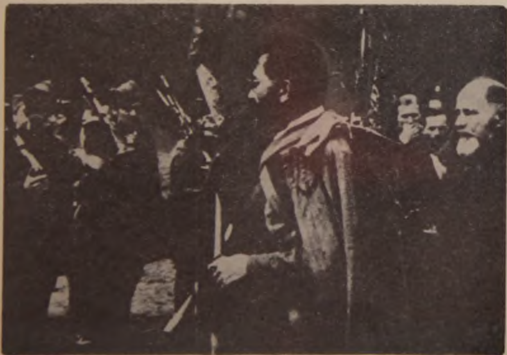
41. Draža Mihailović (u sredini) sa Dragišom Vasićem (iza Mihailovića) vrši smotru Keserovićevoog korpusa po dolasku u Sandžak, maja 1943. godine