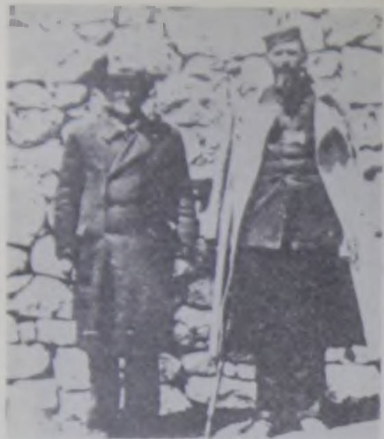
23. Cetnički komandanti u Crnoj Gori: general Blažo Đukanović (levo) i pukovnik Bajo Stanišić (desno)