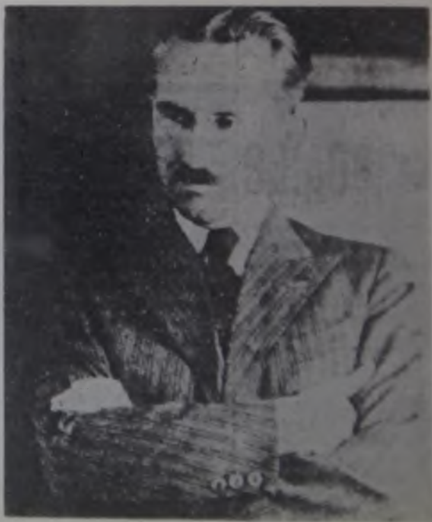
10. Predsednik profašističke organizacije Zbor i siva eminencija kvislinske uprave Srbije Dimitrije-Mita Ljotić