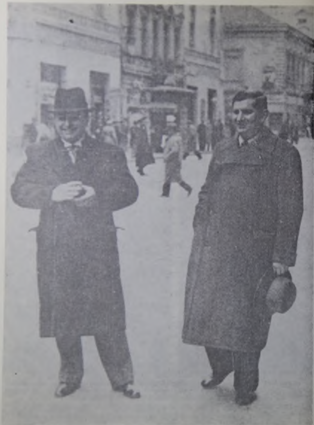
1. Šef kvizitinske komesarske uprave Srbije i komesar unutrašnjih poslova 1941. godine Milan Aćimović (levo) i upravnik grada Beograda i predsednik Beogradske opštine, kasnije šef kvizitinske bezbednosti u Srbiji Dragomir-Dragi Jovanović (desno)