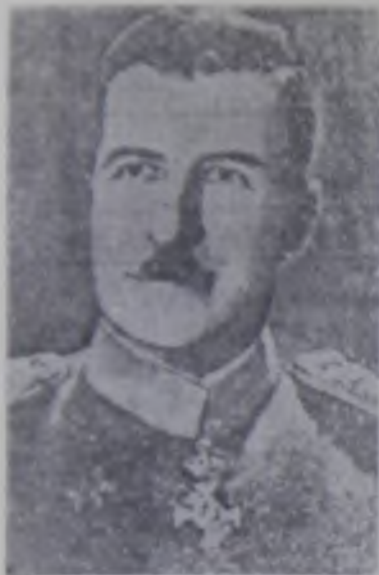
28. General Bogoljub Ilić, ministar vojske, mornarice i vazduhoplovstva u emigrantskoj vladi do januara 1942. godine