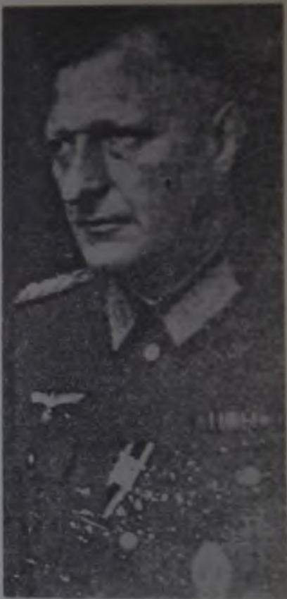
1. Zapovednik okupirane Srbije nemački general Hajnrh Dankelman, 1941. godine 2. Šef vojne uprave okupirane Srbije državni savetnik nemački general dr Vilhelm Turner