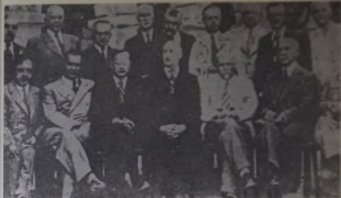
26. Jugoslovenska emigrantska vlada posle bekstva iz zemlje. General Dušan Simović (u prvom redu u sredini). Potpredsednici vlade: Juraž Krnjević (desno od Simovića) i dr Slobodan Jovanović (levo od Simovića). Ministar spoljnih poslova Momčilo Ninčić (prvi zdesna)