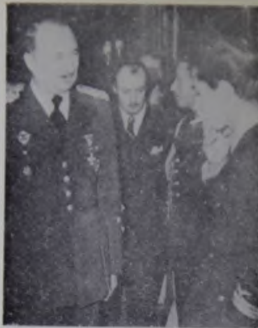
24. General Dušan Simović (levo) u razgovoru sa kraljem Petrom II (sa cigaretom u ustima)