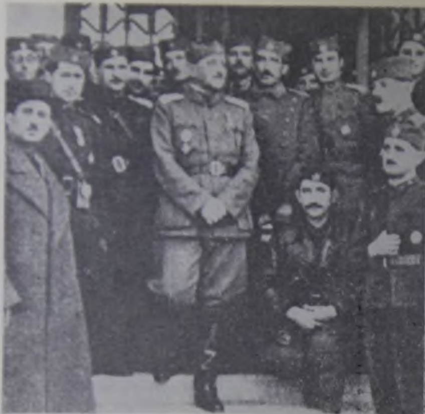
11. Komandant kvistlinške Dobrovoljačke komande (Ijotićevaca) pukovnik, kasnije general Kosta Mušicki (u sredini) okružen svojim Jednomišljenicima