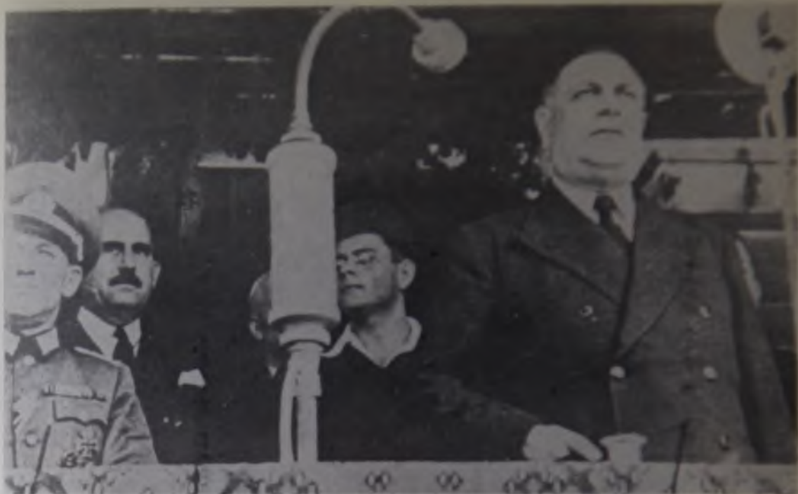
9. Predsednik kvislinske vlade Srbije general Milan Nedić (prvi zdesna) poziva u borbu protiv NOP