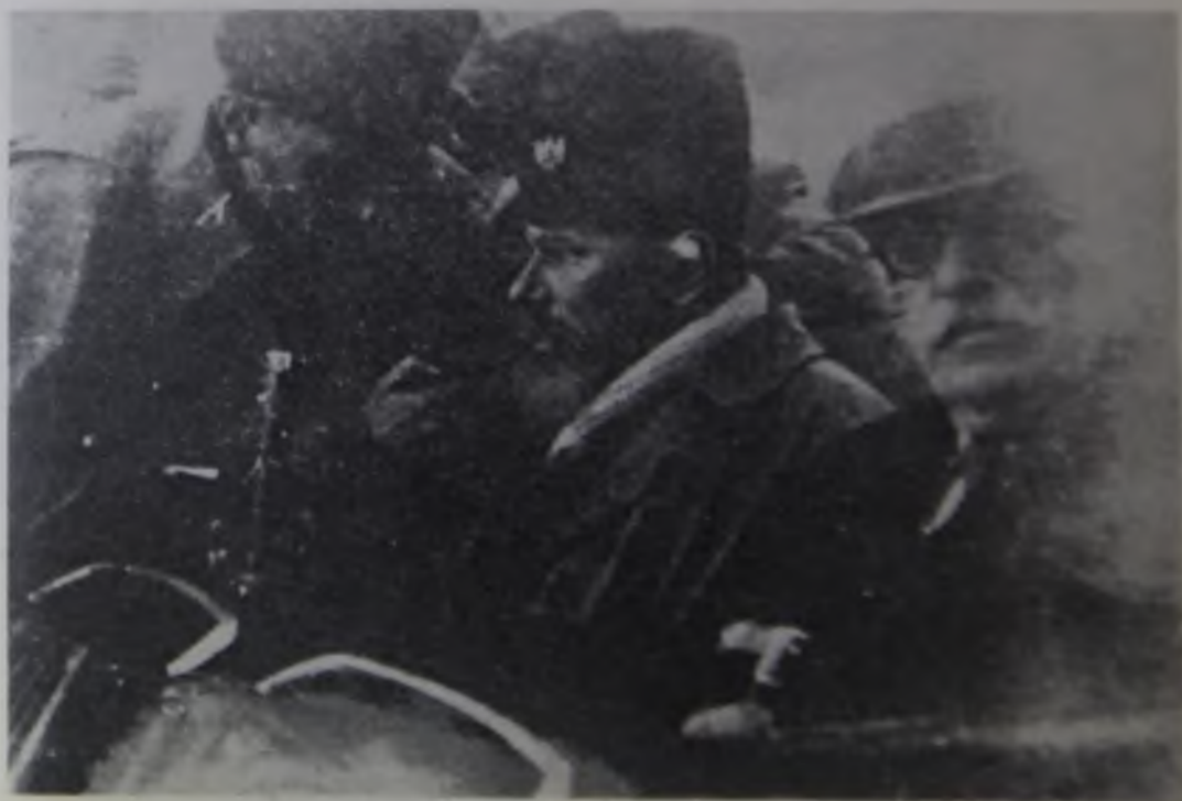
6. Šef kvistlinške četničke organizacije vojvoda Kosta Milovanović Pečanić (u sredini)