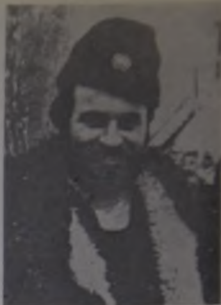
20. Major Vojislav Lukačević organizator Mihallovićevog pokreta i komandant u Sandžaku