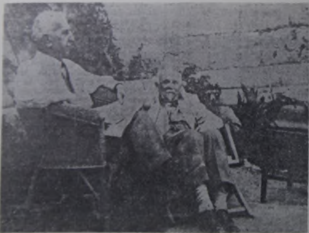
30. Dr Slobodan Jovanović, predsednik emigrantske vlade od januara 1942. godine do sredine 1943. godine (desno) u razgovoru sa ministrom spoljnih poslova Momčilom Ninčićem (levo)