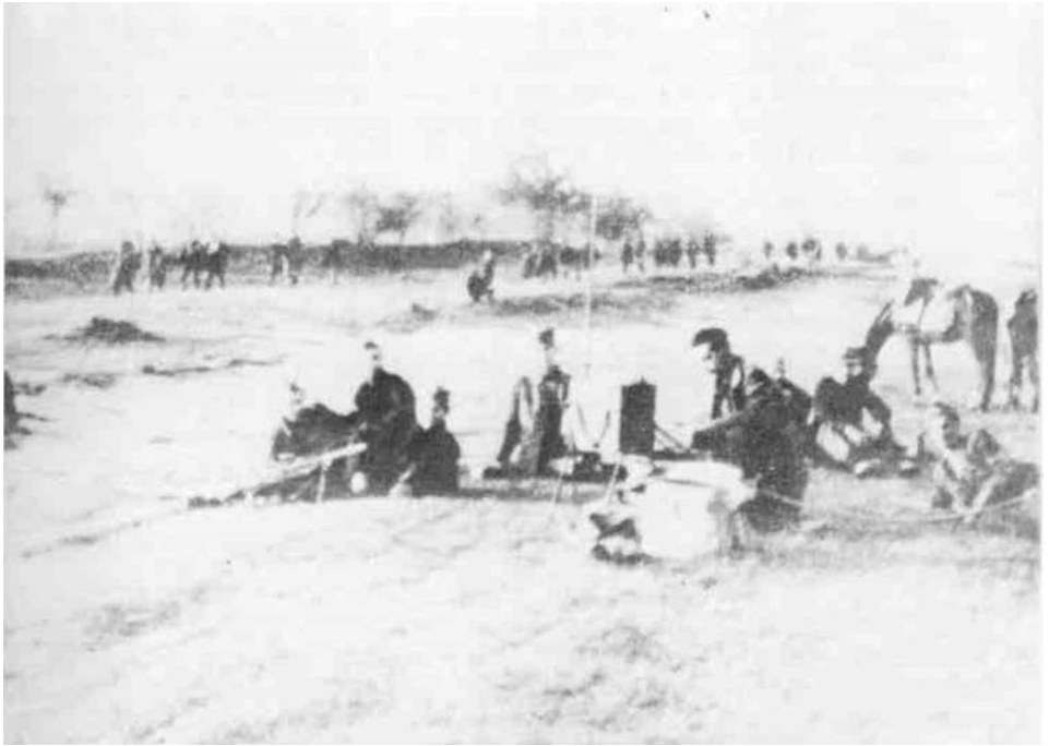
Вригдна радио-станица на застанку, новембра 1944. године.

мену. Поред тога, у организацијама је био интензиван и теоретски рад. У протеклом периоду су обновљене следеће теме: