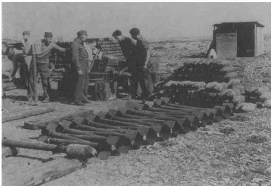
Oružari Druge eskadrile pripremaju rakete