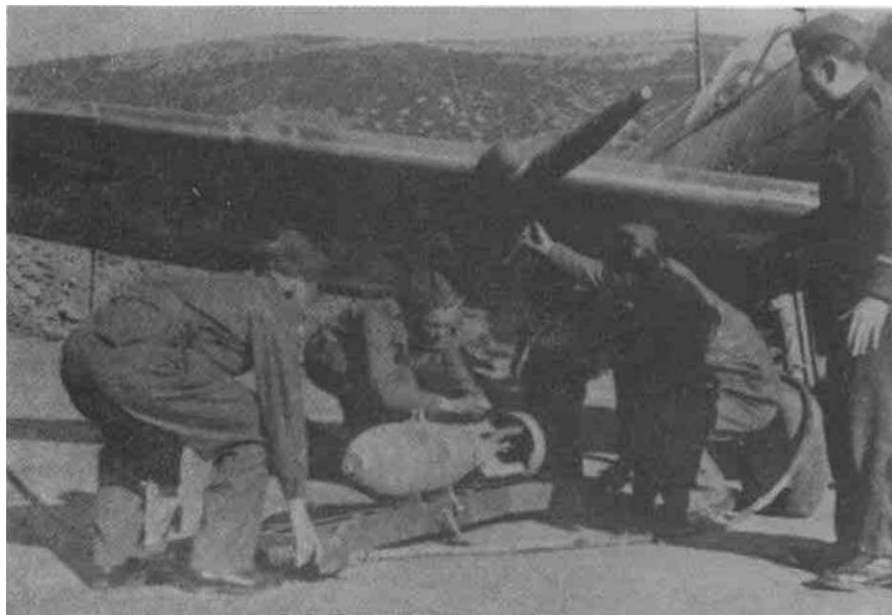
Postavljanje bombi pod krilo 'spitfajera'