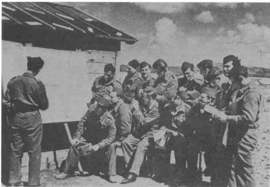
Piloti Druge eskadrile pred poletanje sa aerodroma Prkos kod Zadra