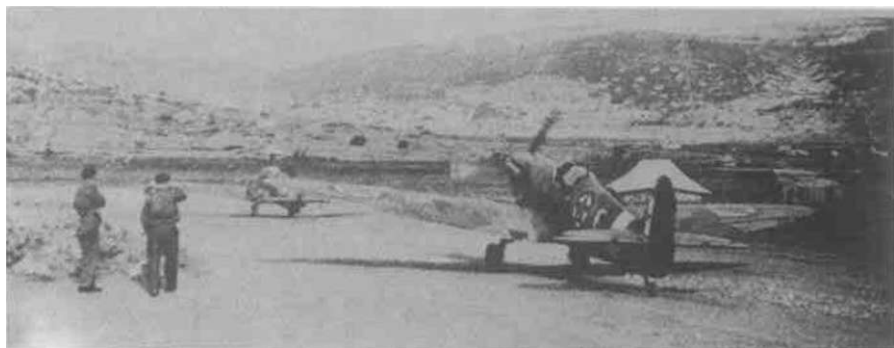
'Spitfajeri' Prve eskadrile kreću na zadatak sa aerodroma na Visu

Piloti Druge eskadrile, sa engleskim instruktorima, po završenom raketnom kursu u Šalufi u Egiptu