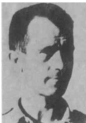
Pilot Druge eskadrile Nikola Vemić, poginuo pri napadu na Netce u Lici