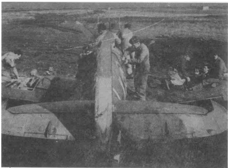
Pripremanje 'spitfajera' za zadatak