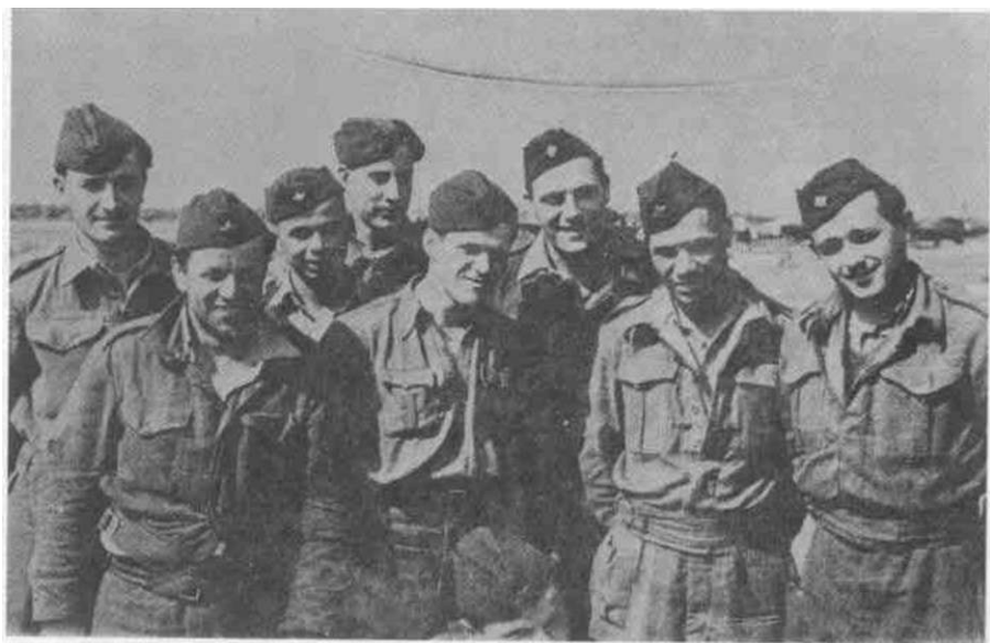
Grupa mehaničara Druge eskadrile na aerodromu Prkos kod Zadra