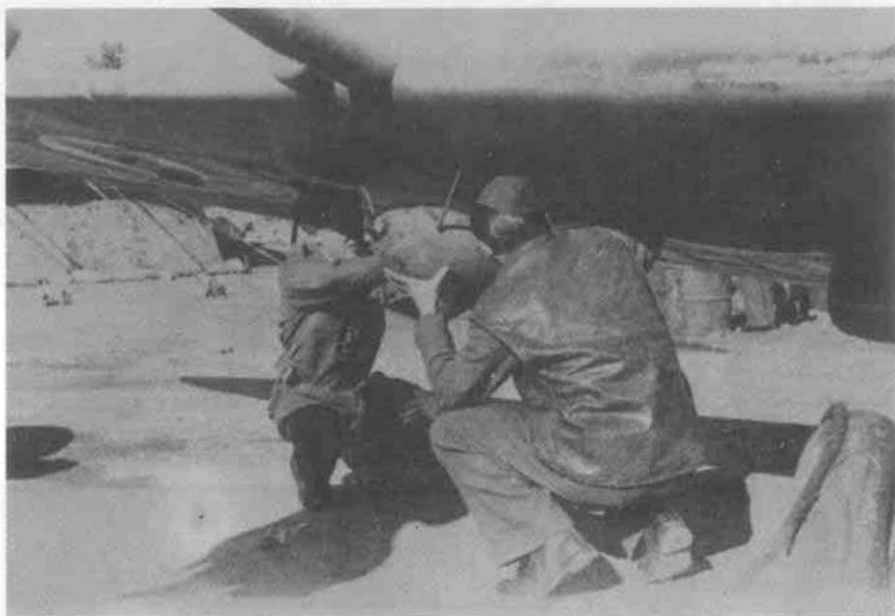
Postavljanje bombi na krila 'spitfajera'