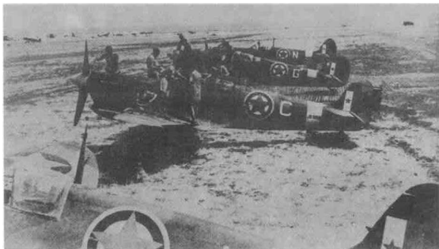
Priprema 'spitfajera' Prve eskadrile za let