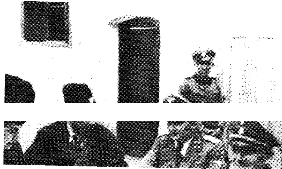
Četnici i pripadnici nemačkih SS-trupa