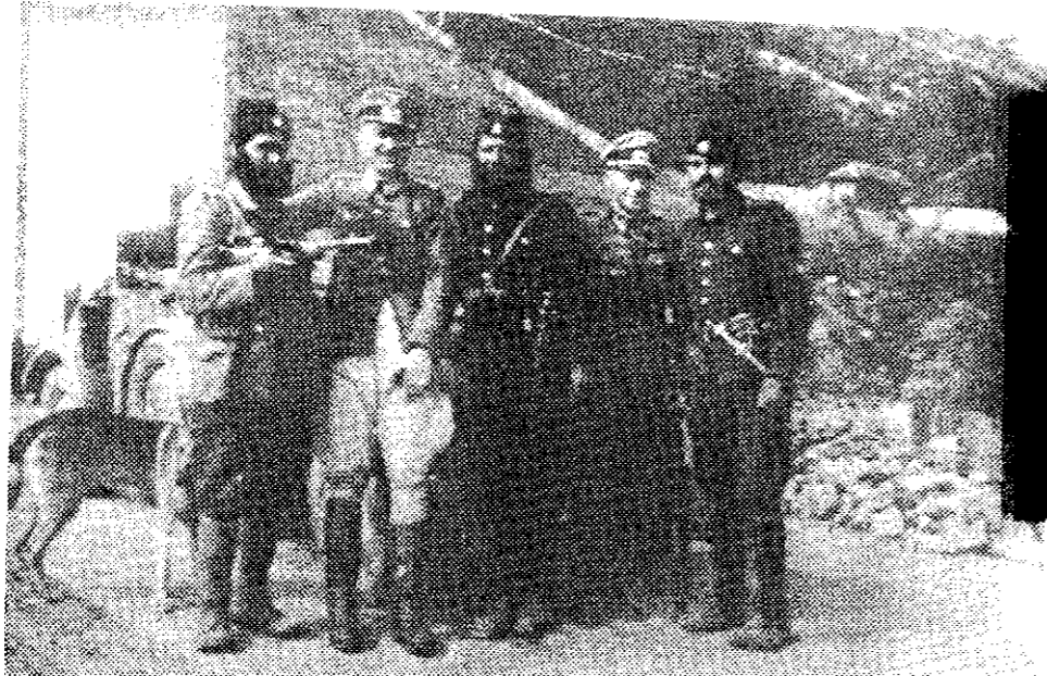
Četnici i nemački okupatori