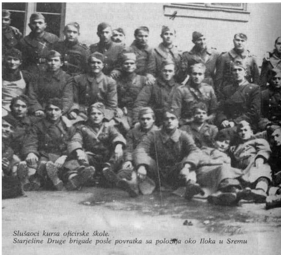
Slušaoci kursa oficirske škole. Stariješine Druge brigade posle povratka sa položaja oko Iloka u Sremu