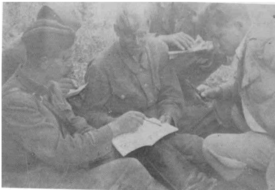
Izviđačka četa Druge brigade. Rad na opismenjavanju nepismenih