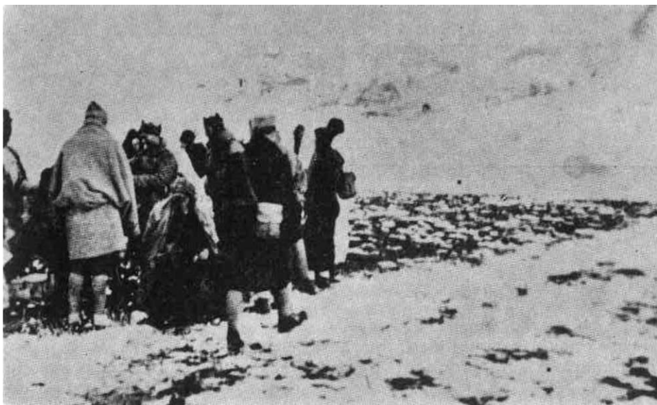
Borci 1. bataljona u selu Rostovu kod Novog Travnika, decembra 1942.

Na osnovu postavljenog zadatka štab brigade izradio je plan djeljstva bataljona, kao i plan političke aktivnosti u okolnim selima i vojno-politički i kulturno-prosvetni rad po jedinicama brigade. Navodimo podatke o radu u brigadi iz izvještaja zamjenika političkog komesara 1. brigade upućenog CK KPJ od 18. januara 1943. godine.