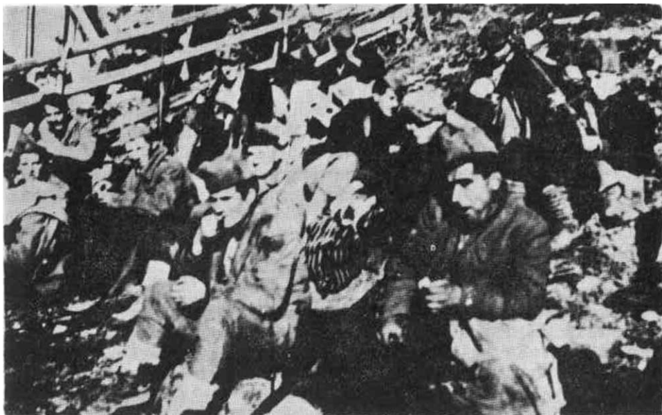
Uoči napada na neprijateljsko uporište u Jajcu, novembra 1943.