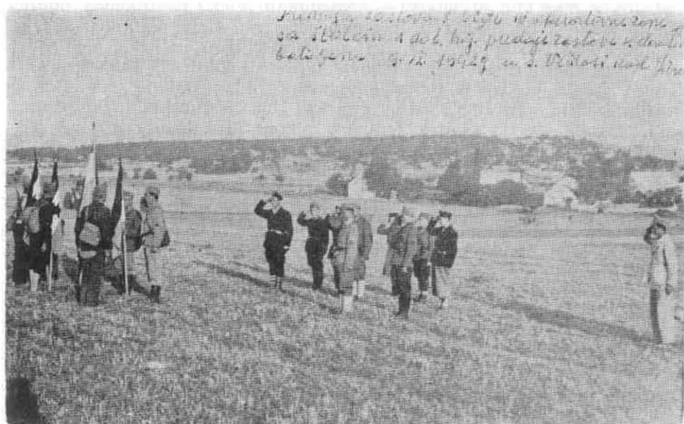
Komandant brigade u prisustvu štaba 4. operativne zone predaje bataljske zastave zastavnicima