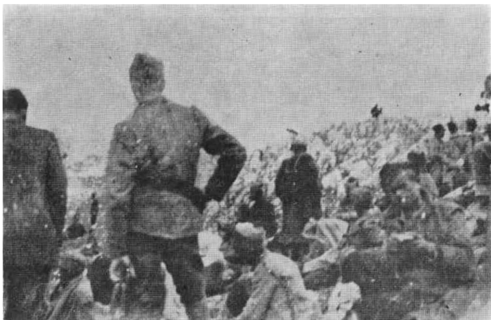
Borci brigade kod sela Podhum, južno od Livna, u jesen 1942.