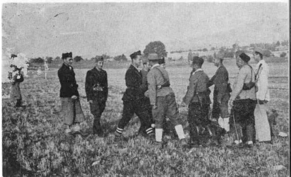
Stab 4. operativne zone čestita Stabu brigade poslije polaganja zakletve