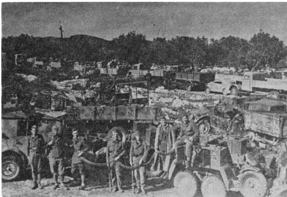
Motorna vozila 369. njemačke divizije koju je zaplijenila 1. dalmatinska brigada u borbama u rejonu Neum – selo Radež. oktobra 1944.

omogućiti blokiranim snagama u rejonu sela Radež da se izvuku. Taj napad uspješno je odbio 4. bataljon 11. brigade.