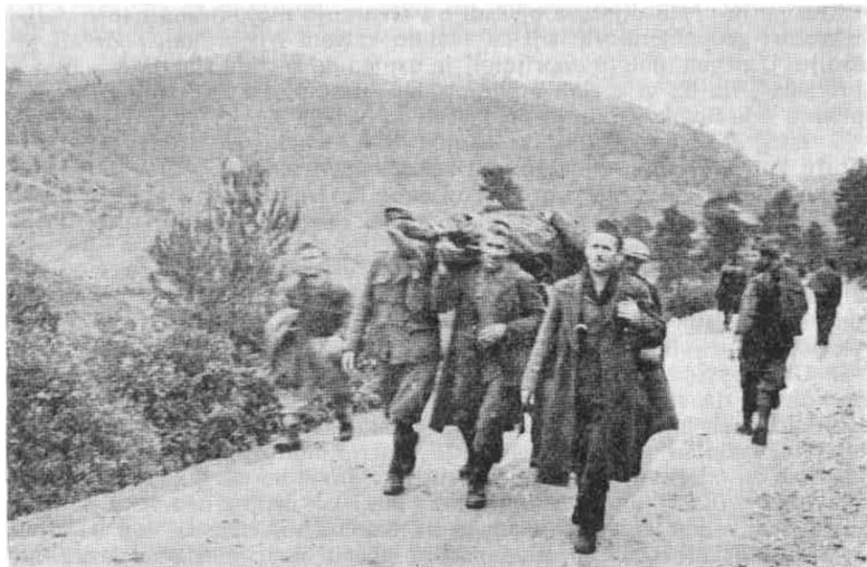
Evakuacija ranjenika poslije borbe na položaju Smokvica – Cara na Korčuli, 24. 12. 1943.

Silovitim jurišom 1. i 4. bataljona podržanih četom pratećih oruđa 4. bataljona 1. brigade uspjeli su da odbace neprijatelja sa isturenih položaja ka selu Care. Neprijatelj je poslije kratkog sređivanja, podrškom vatre artiljerije, minobacača i pokretom i vatrom tenkova, prešao u protivnapad duž komunikacija Care – Smokvica.