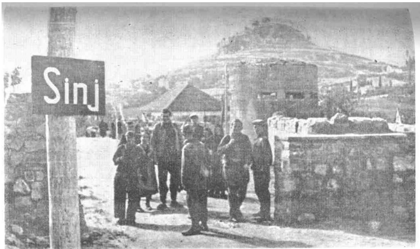
Borci 20. divizije u tek oslobođenom Sinju