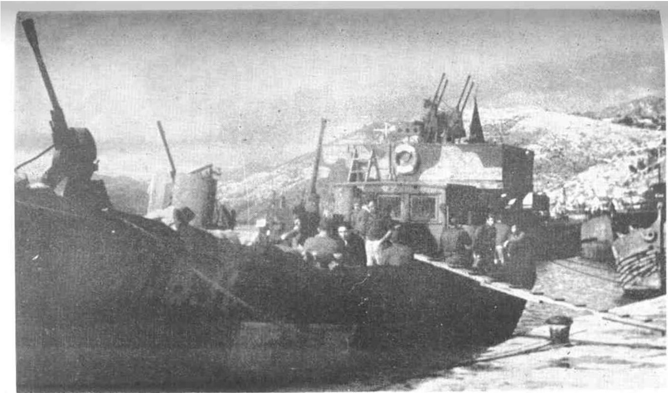
N. B. 11 u luci Gruž posle oslobodenja Dubrovnika