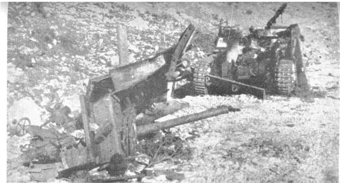
Uništena borbena tehnika nemačke 339. legionarske divizije u vreme borbi kod Vukovog klanca