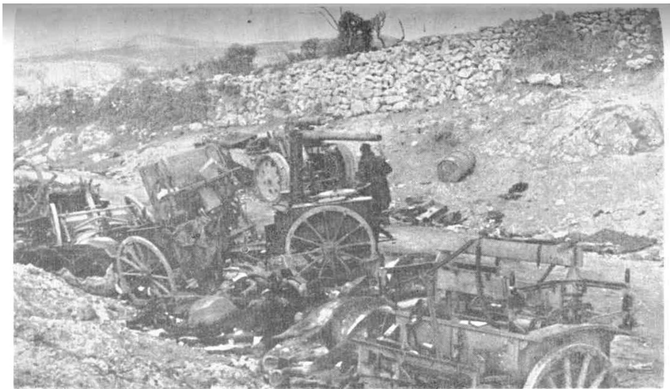
Uništena borbena tehnika nemačkih jedinica u borbama za Knin