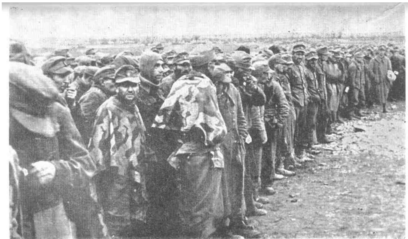
Zarobljeni nemački vojnici u borbama za Knin