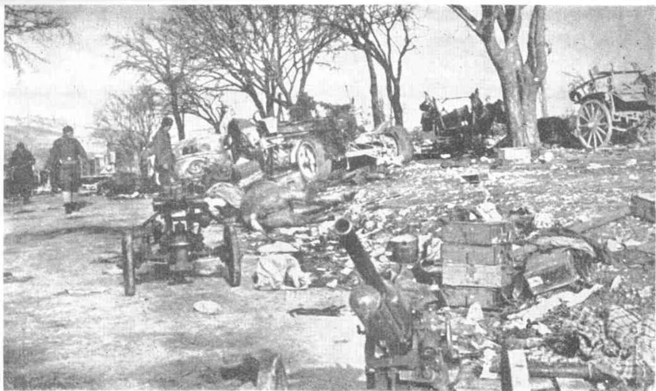
Ostaci nemačkih jedinica posle borbi za Knin