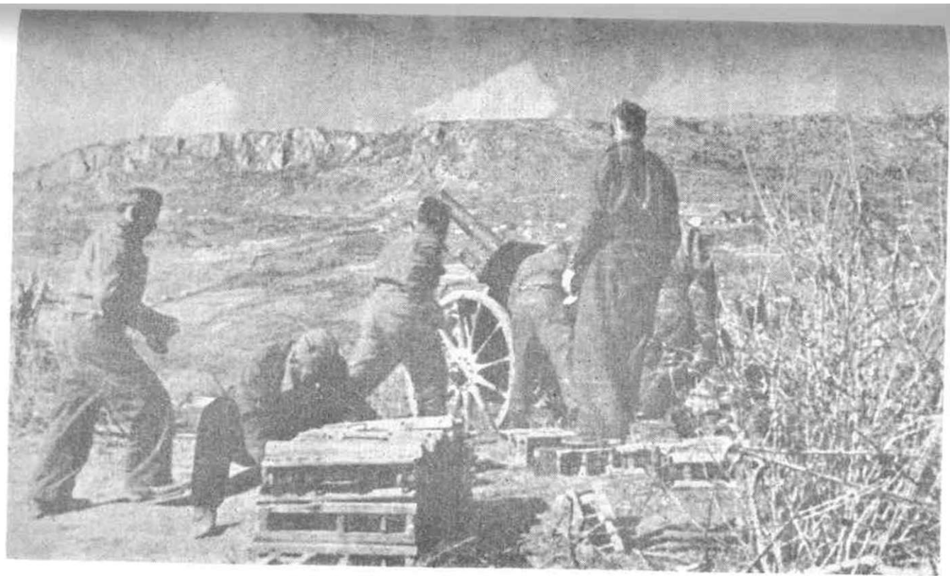
Delovi artiljerije 8. korpusa u borbi za Knin