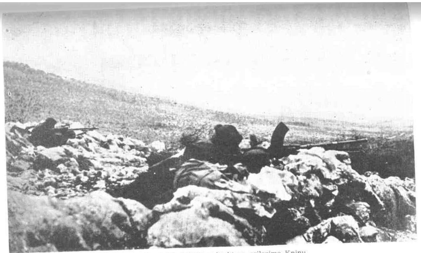
Borci 26. divizije u borbi na prilazima Kninu