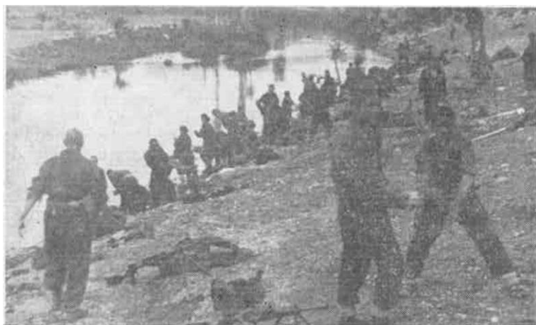
Delovi (1. brigade, posle izvedene akcije na Nemce u Modravatna, odmaraju se na obali Vranskog jezera — juni 1944. godine

Pošto je bataljon izbio na navedeni put, nastupao je u borbenom rasporedu prema kanalu na Prošici i napao odsek od obale Vranskog jezera do obale mora koji su branili Nemci.