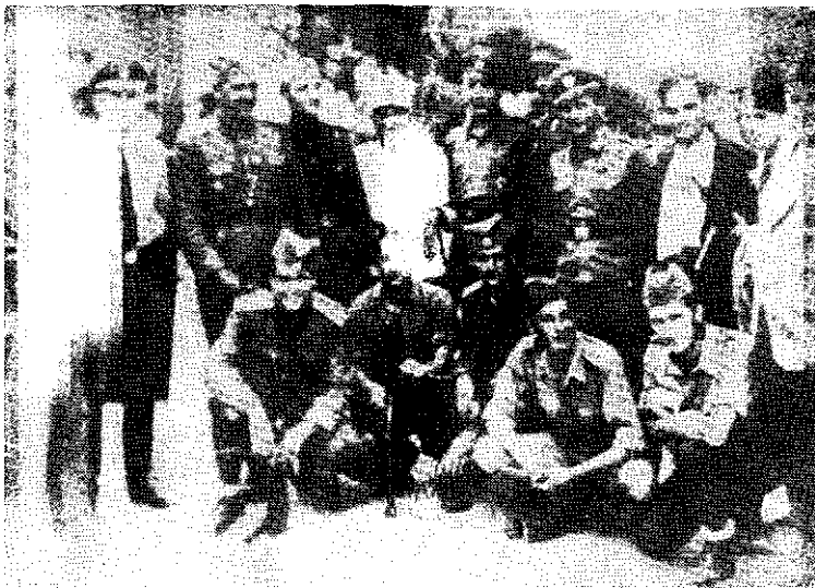
Припадници СДС са немачким официрима у Србији 1943. године