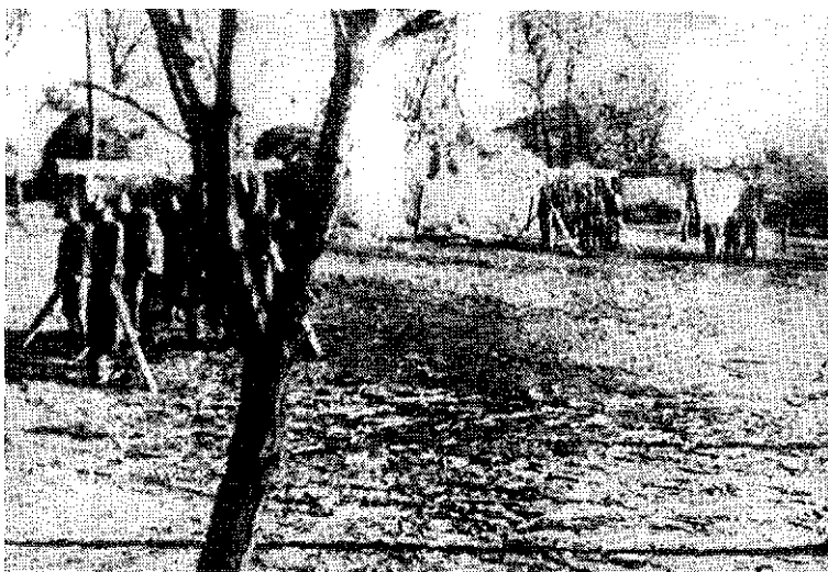
Новембар 1943. године. Немци су обесили двадесеторицу родољуба у Аранђеловцу

Немци и Бугари, као ни домаћи издајници, посебно четници, нису бирали средства и начин борбе против НОП-а. Предузимали су све да сузбију и угуше тај покрет, од борбених дејстава до најтежих мера одмаз-