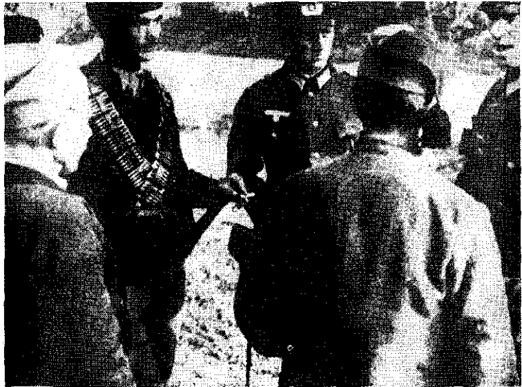
Четници примају задатке од господара којима служе

Снажније позиције четници су половином 1943. задржали у Србији, где су поново пренели тежиште својих дејстава. Од априла они у Србији и не крију сарадњу са окупатором, а са Гестапоом и Специјалном полицијом успоставили су непосредне везе за борбу против ослободилачког покрета. На њихов захтев су хапсили, приводили или убијали људе за које су претпостављали да сарађују с партизанима.