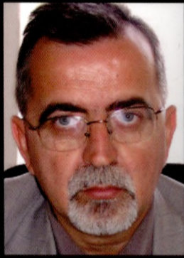
Гојко Лазарев судија Окружног суда у Шапцу